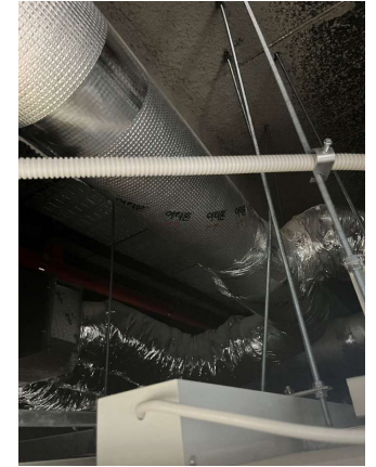
천장 위 전산볼트 고정 예시