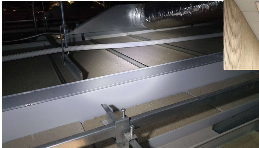
천장 위 설치 예시 (기존 빔스크린)